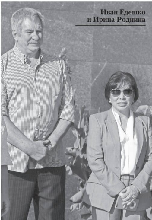
Иван Едешко и Ирина Родина

Вчера III Международный фестиваль школьного спорта стран СНГ открыла торжественная церемония возложения венков к монументу погибшим на фронтах Великой Отечественной войны на площади 30-летия Победы.