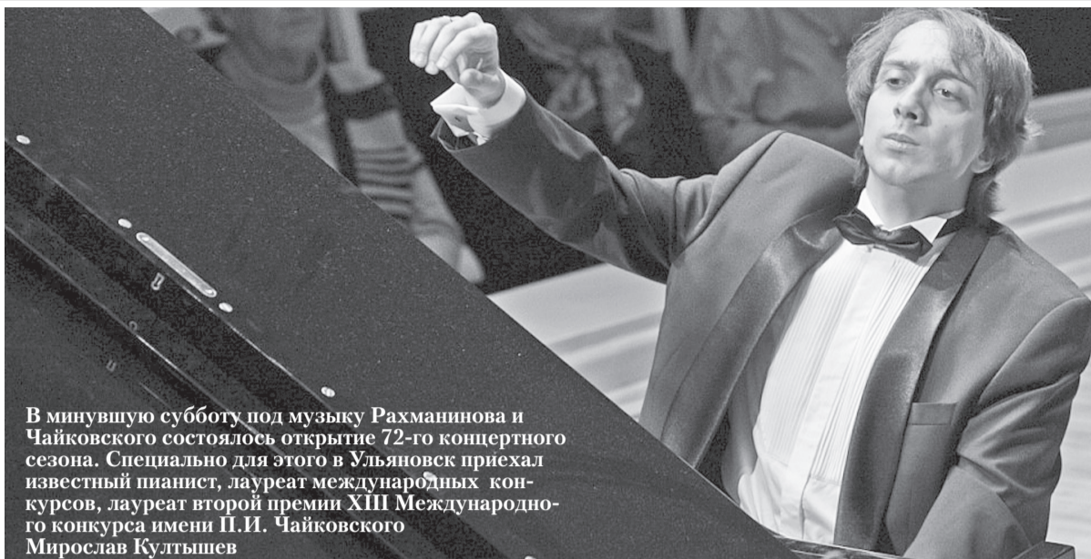
В минувшую субботу под музыку Рахманинова и Чайковского состоялось открытие 72-го концертного сезона. Специально для этого в Ульяновск приехал известный пианист, лауреат международных конкурсов, лауреат второй премии XIII Международного конкурса имени П.И. Чайковского Мирослав Кутышнев